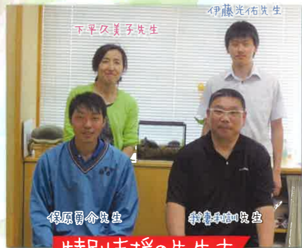
特別支援の先生方

私たちは、10名の生徒の皆さんと1匹のカメと「みんなで助け合い学び合い協力してがんばろう!!」をスローガンに、楽しく毎日過ごしています。