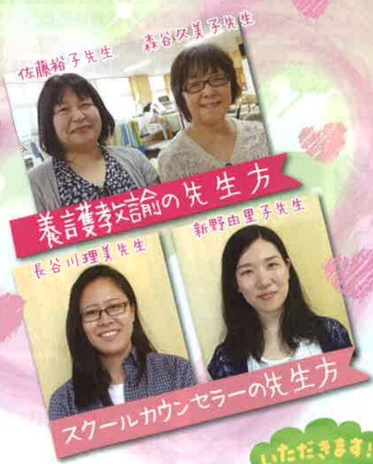
養育教諭の先生方 スクールカウンセラーの先生方