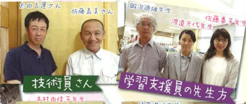
学習支援員の先生方