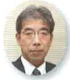
「考える葦」 になって