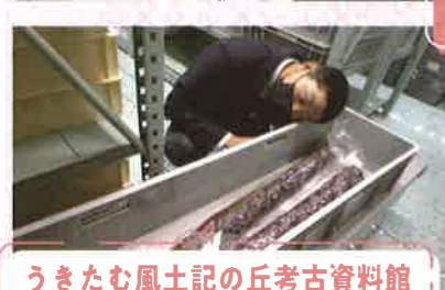
うきたむ風土記の丘考古資料館