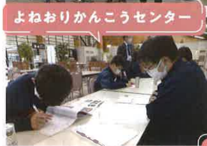
よねおりかんこうセンター