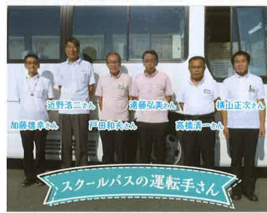
スクールバスの運転手さん