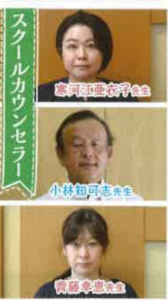
スクールカウンセラー